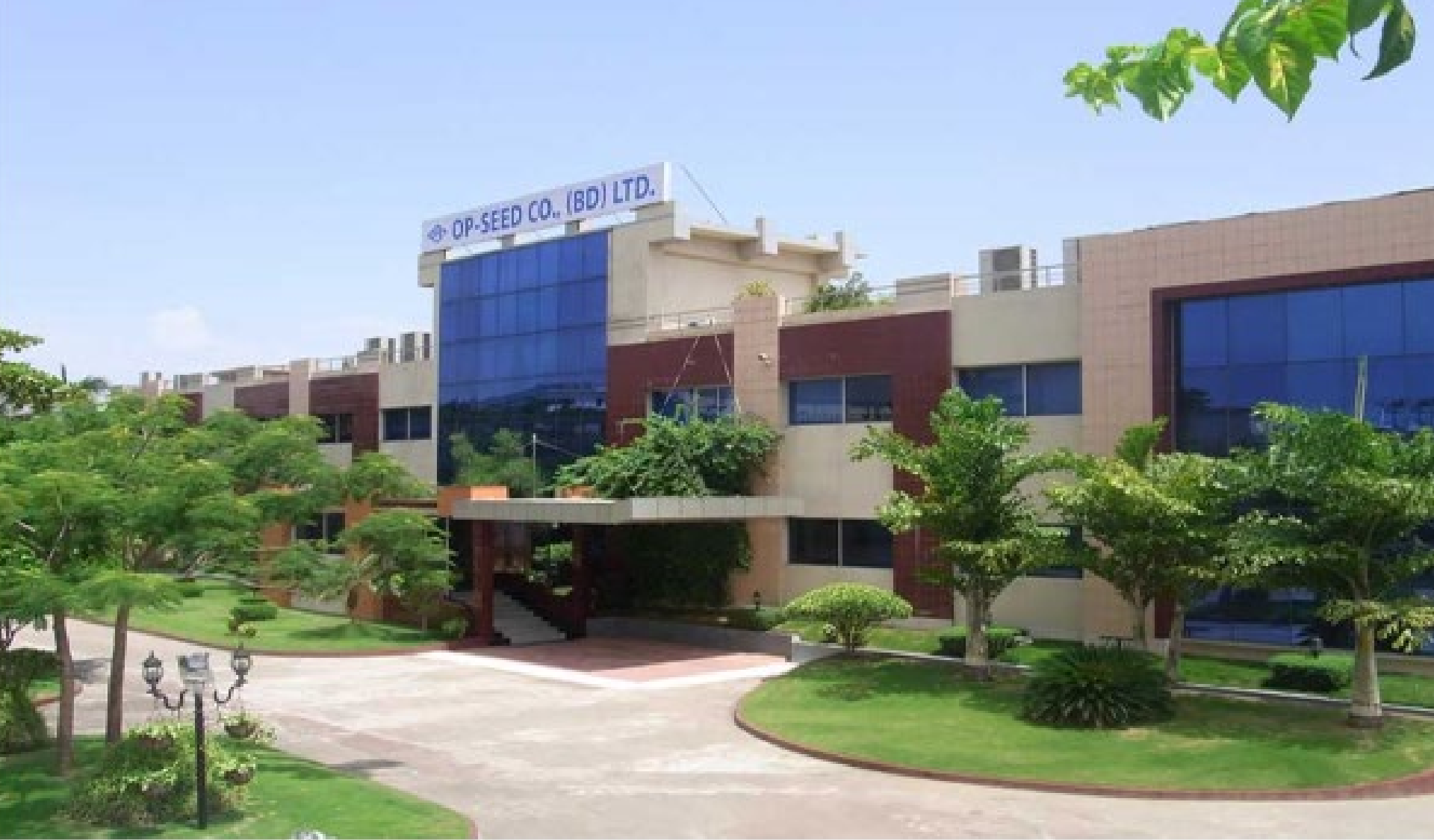
OP-SEED CO., (BD) LTD. at Chittagong EPZ Chittagong, Bangladesh