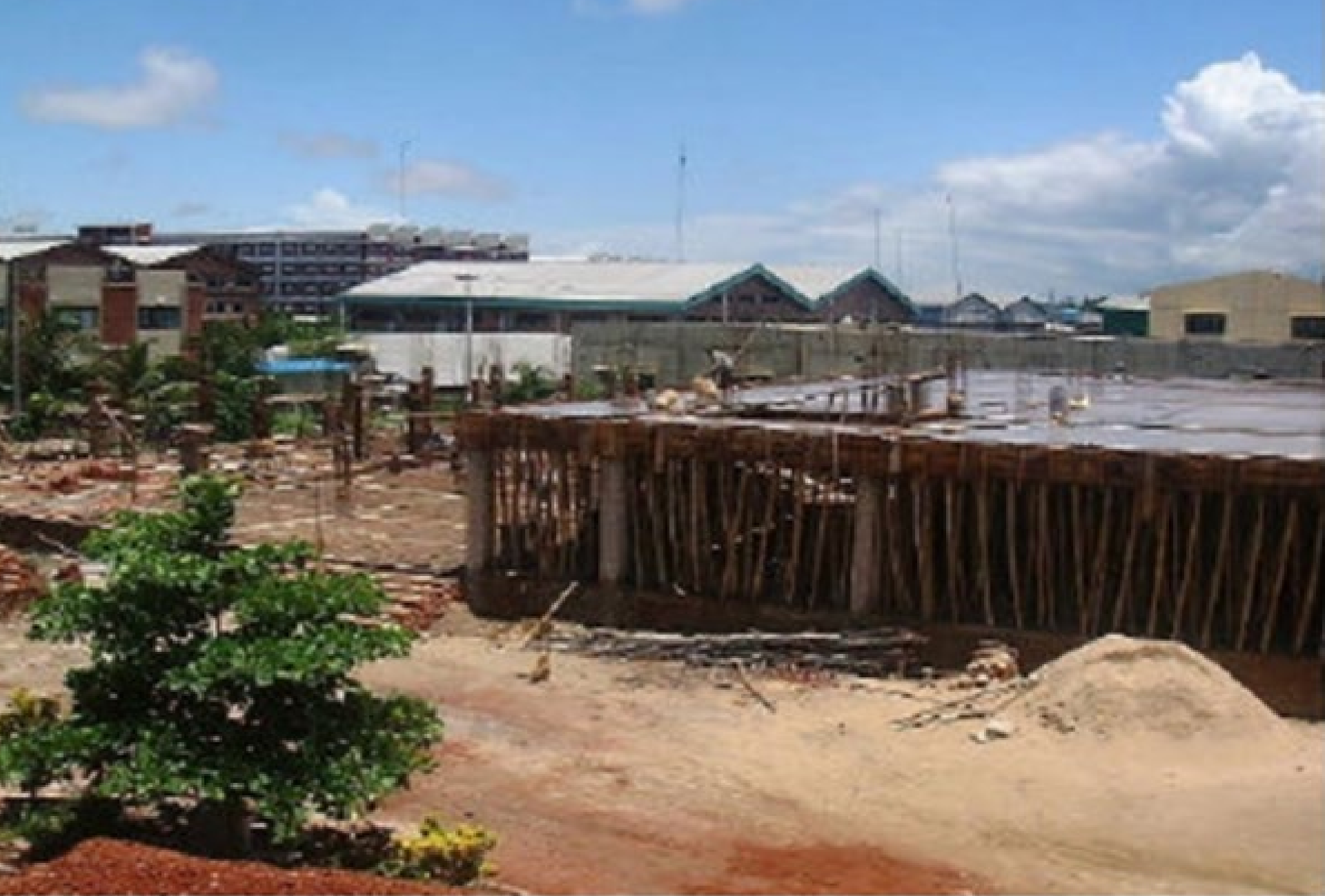
New Building under Construction