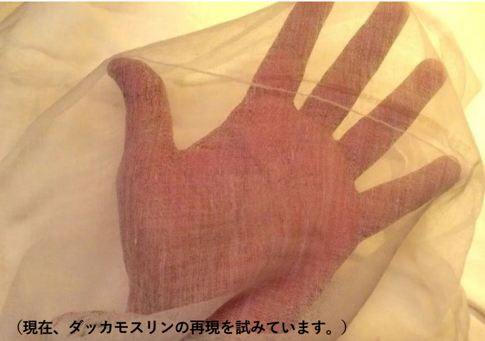
(現在、ダッカモスリンの再現を試みています。)