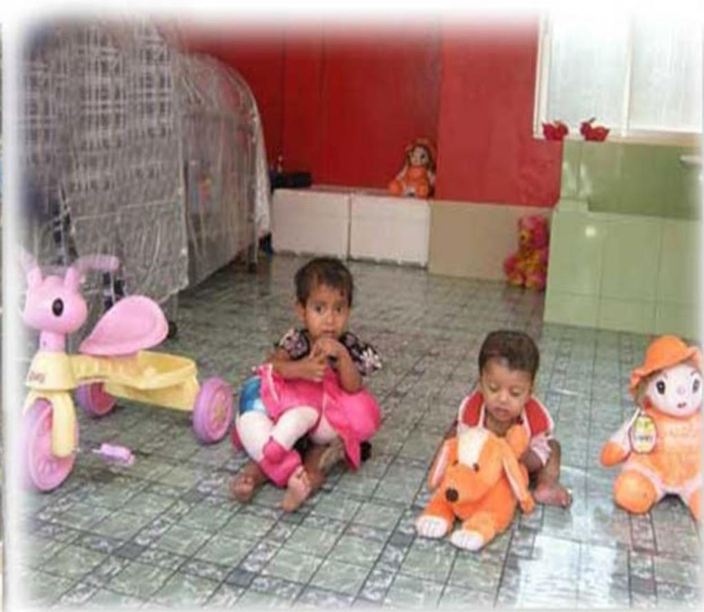
Child Care Home