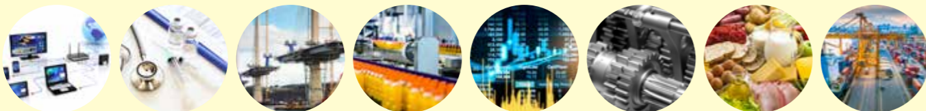
IT 医療 インフラ 加工業 金融 工業 農漁業 貿易