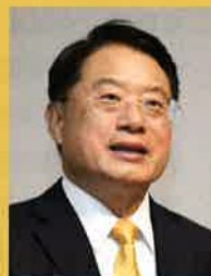
リー・ヨン UNIDO事務局長

また、外務省、経済産業省、日本貿易振興機構(JETRO)、新エネルギー・産業技術総合開発機構(NEDO)、日本国際協力機構(JICA)など日本政府・政府機関に加え、経済