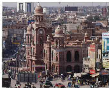
ムルターンの時計塔

来日は今回で3回目ですが、日本はとても好きな国で、来るたびに多くのことを学んでいます。滞在中は大阪でセミナーを行い、約50名の参加者にパキスタンのビジネス環境を紹介したほか、ビジネスマッチングイベントに出展し、約15の企業と面談しました。東京でも、既にパキスタンに進出済み、または進出を考えている日本企業とラウンドテーブル・