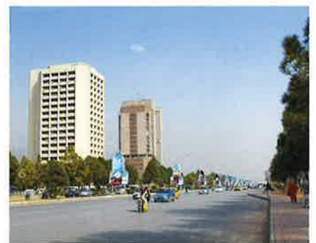
イスラマバードの街並み

産業としては自動車業界が今とても伸びています。ホンダ、スズキ、トヨタなどの各企業は1950年代からパキスタン