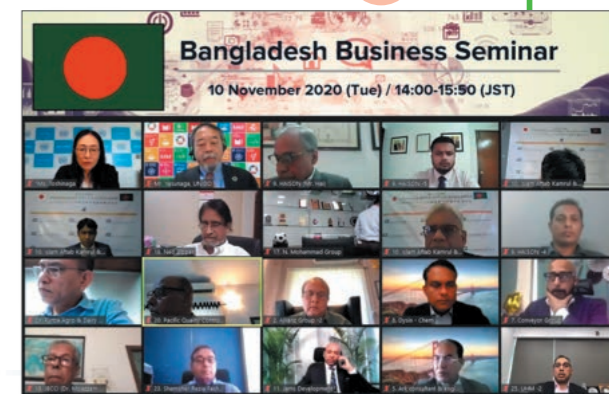
セミナー当日の様子