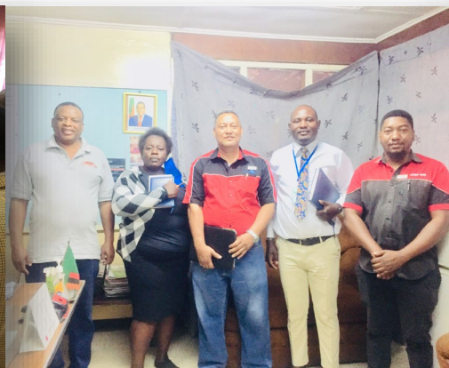
業界関係者がKVTCを訪問しノウハウを共有