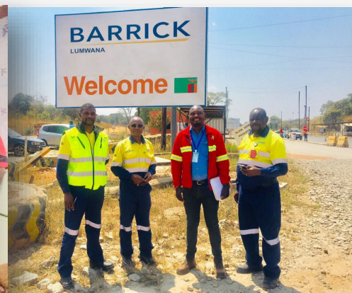
KVTCスタッフが業界関係者を訪問