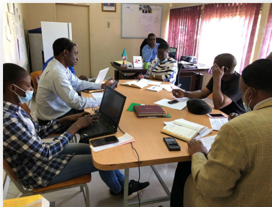
プロジェクトチームとKVTCマネジメントチームによる企画会議