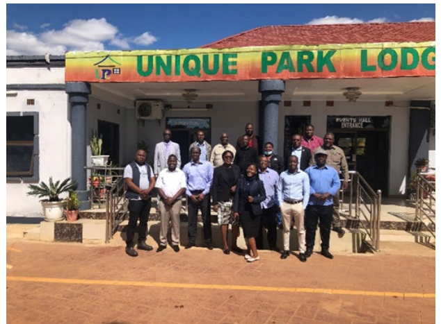
TNA ワークショップでの集合写真