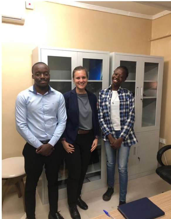
UNIDO モロッコ事務所の M&E 専門家とともに 知見共有の会合を開催