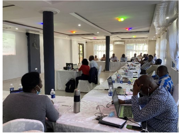
TNA ワークショップでの写真