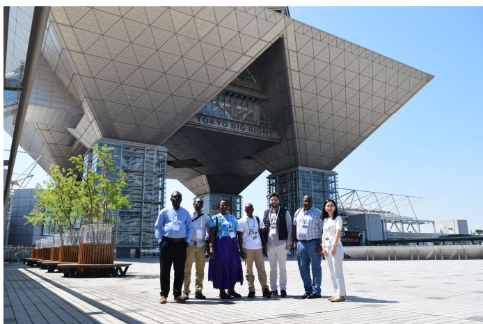
第37回 オートサービスショー