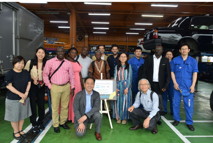
現地視察@日章自動車興業株式会社