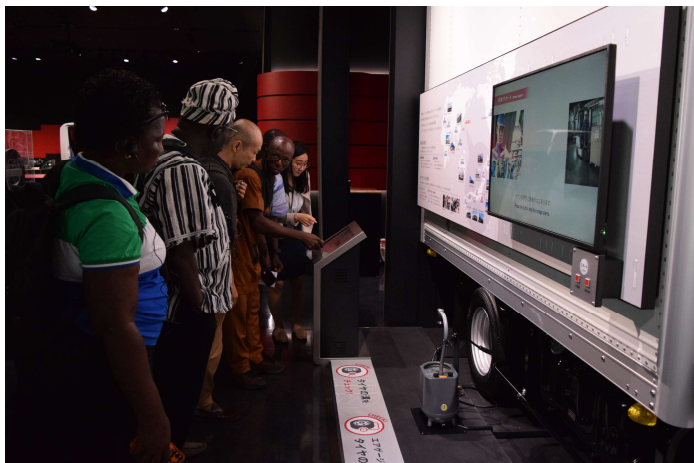
見学@いすゞプラザ