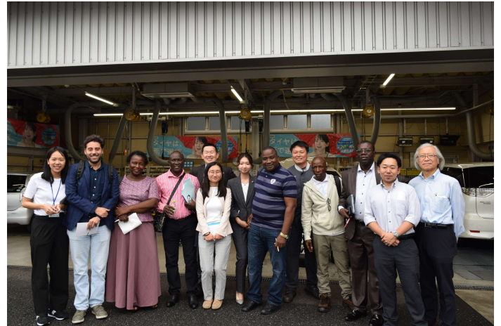
現地視察@ヤマヒロ株式会社