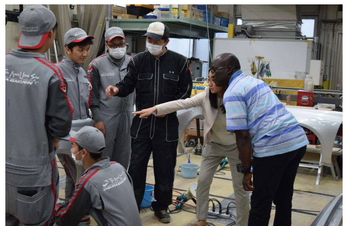
現地視察@東京自動車大学校