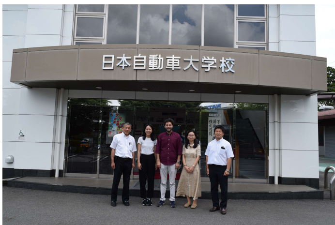
現地視察@日本自動車大学校