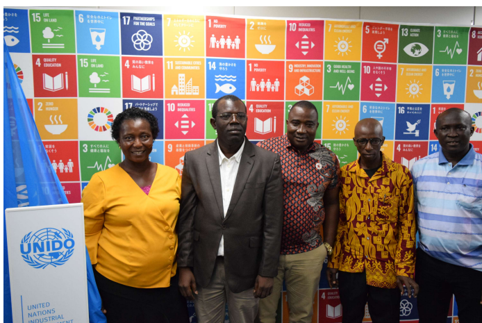
シエラレオネ代表団