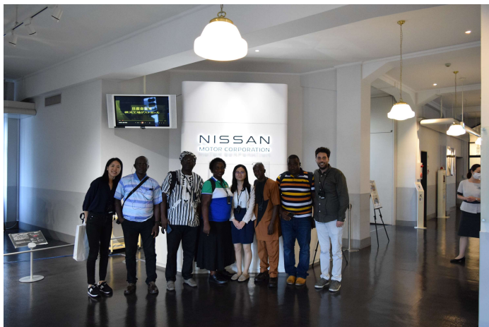
見学@日産自動車横浜工場