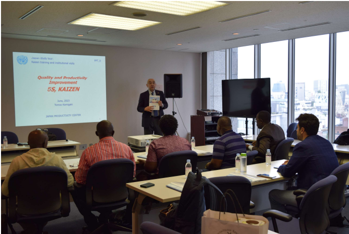
日本生産性本部によるカイゼントレーニング@国連大学