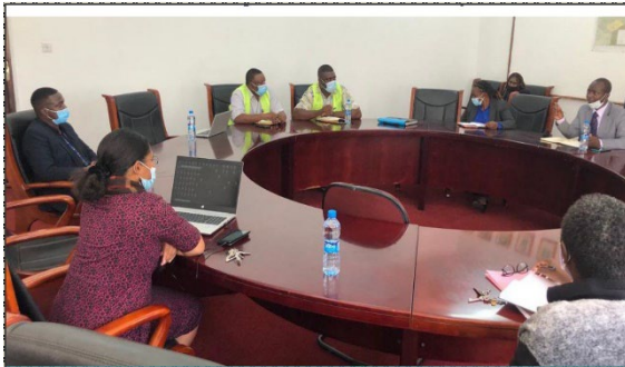
KVTC及びプロジェクトスタッフの科学技術省訪問の様子