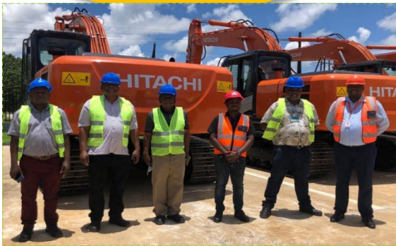
日立建機ザンビア訪問中のKVTC及びプロジェクトスタッフ