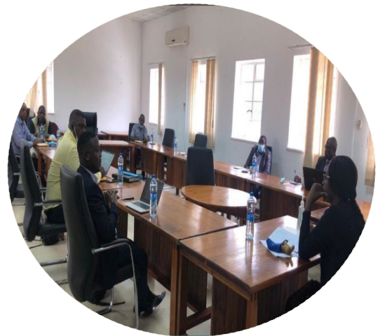
TEVETA訪問中のKVTC及びプロジェクトスタッフ