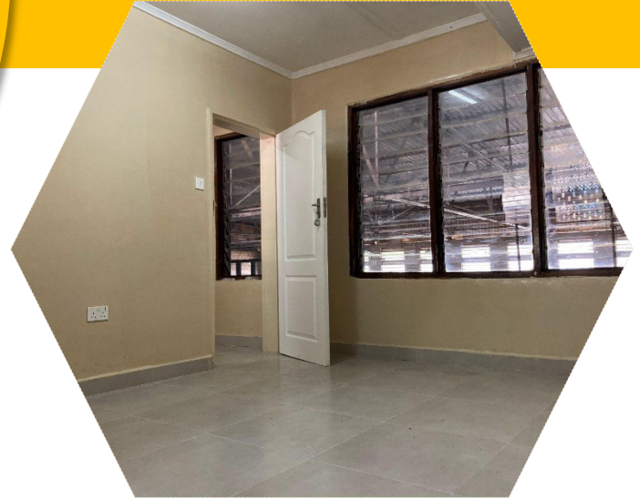
プロジェクト事務所完成イメージ