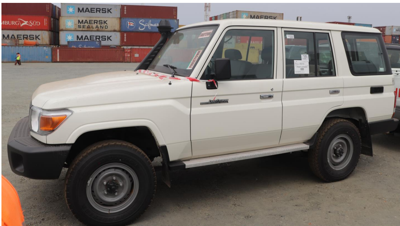
トレーニング用に購入した3台の自動車が生ラレオネに到着