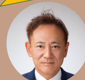
エジプト投資庁 / GAFI