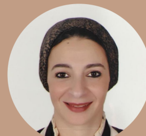
エジプト投資庁 / GAFI