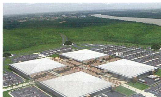
フリーゾーン

今回の来日では、日本各地で自動車関連企業の方々や政府・団体関係者とお会いし、好感触を得ることができました。日本車はナイジェリアでは大変人気があり、国内の自動車の6割以上が日本車です。しかし、最近は中国や韓国のメーカーが進出してきており、徐々にシェアを拡大しています。ナイジェリアはアフリカ随一の約1億5000万人の人口を擁する国で、1999年に民政に移行してからは、政治的にも社会的にも安定してきています。高い技術力を持つ日本企業にも、フリーゾーンなどを活用して、この潜在的に巨大な消費者市場に積極的に進出していただきたいと考えています。