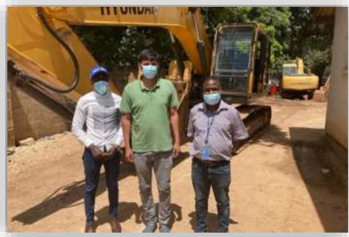
LMS 調査派遣においてハヌマン・アース・ムーバーズ社での集合写真