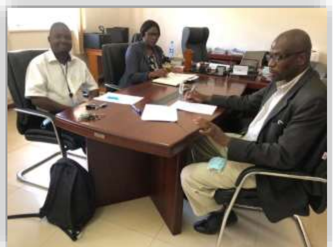
TEVETA 開発部長とカリキュラム策定部長との戦略会議の様子