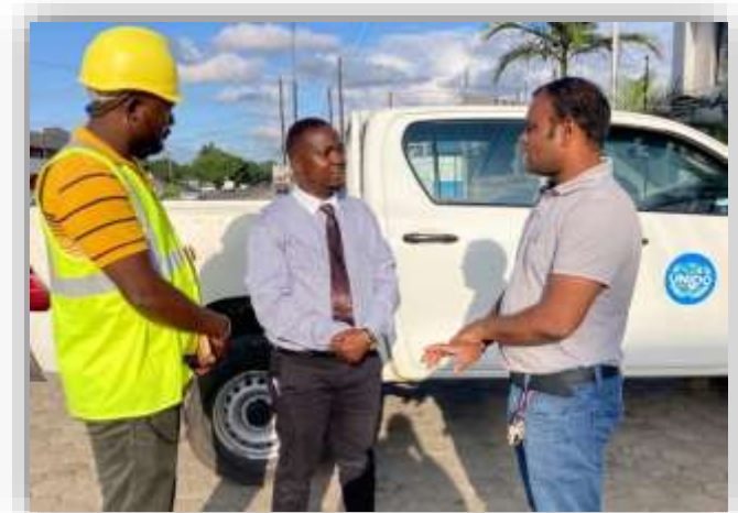
タイタニウム社の専門家との TNA・LMS 調査との相乗効果を狙ったフィールド活動