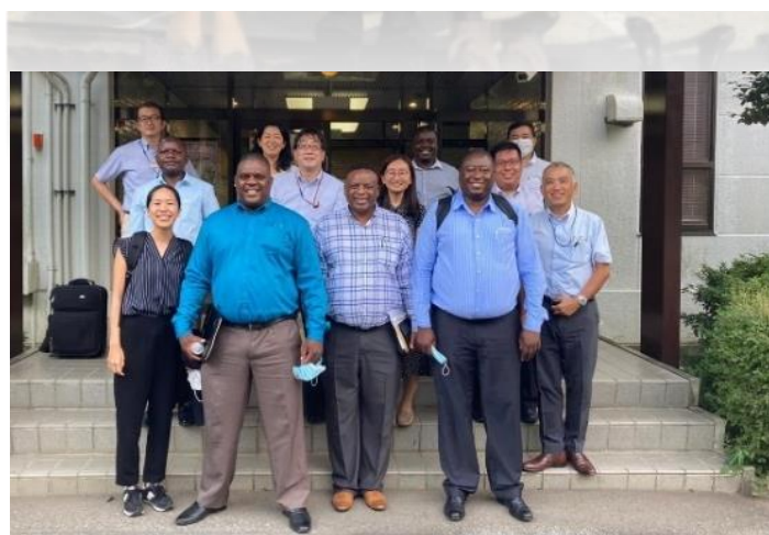
UNIDO、日立建機ザンビアとKVTCの代表者が日立建機のテクニカルトレーニングセンターを訪問し、ノウハウを習得