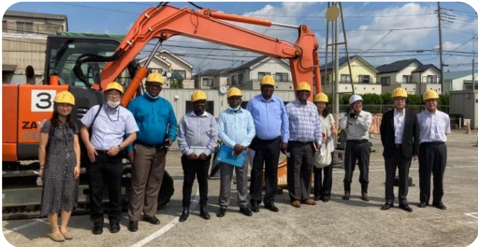
PEO建機教習センター埼玉教習所を訪問するスタディツアーの参加者