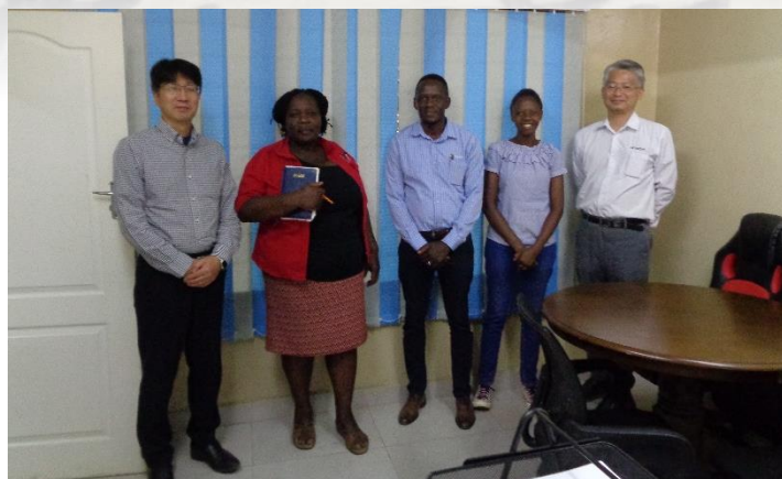
日立建機ザンビアの社長をはじめとした代表団がKVTCを表敬訪問