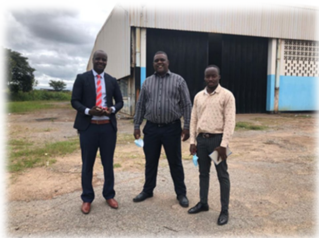
情報共有、協業の可能性を模索することを目的とした、KVTC と Heavy Duty Operators College of Zambia のミーティング