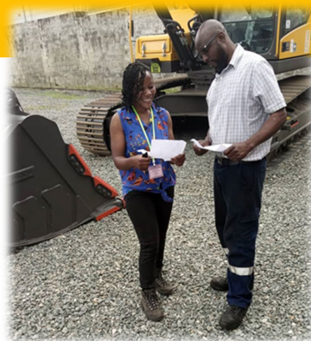
労働市場の聞き取り調査をする調査員