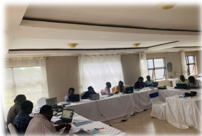
KVTC スタッフを対象とした M&E 研修