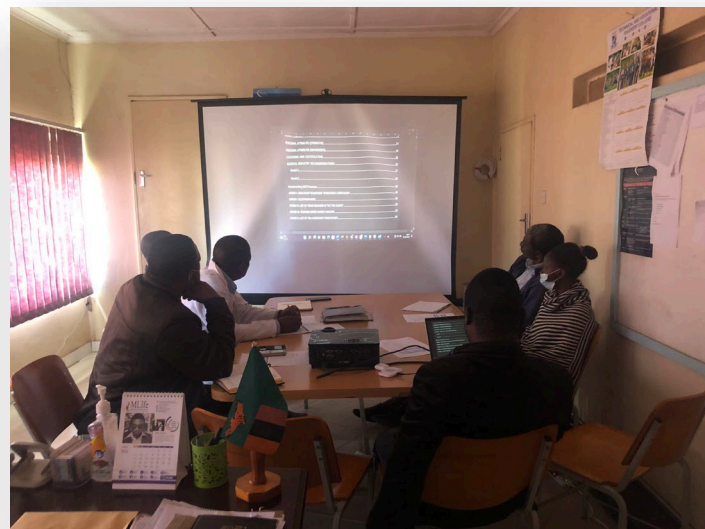
訓練ニーズ調査データを分析するKVTCの技術チームとプロジェクトチーム