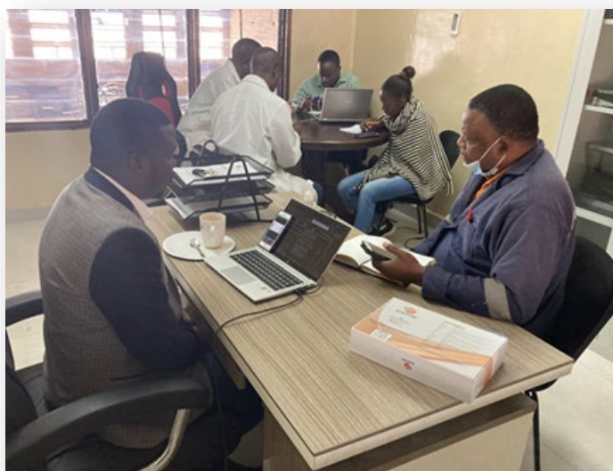
KVTCとプロジェクトチームが日立建機とプロジェクトの進捗に関するミーティングをオンラインで実施