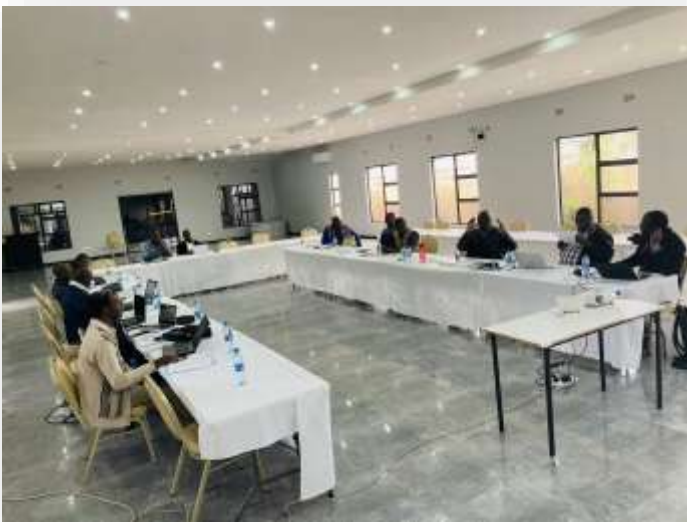
CEOカリキュラム開発に関する第1回 ワークショップ