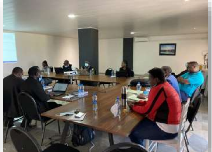
CEOカリキュラム開発に関する第2回ワ ークショップ